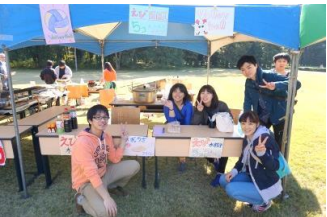
バレーボール部～水餃子