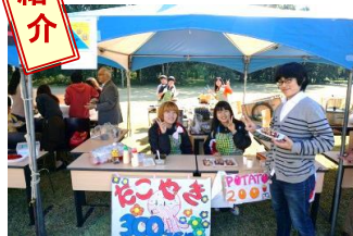
硬式庭球部～たこ焼き&フライドポテト