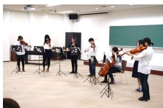
ストリングスオーケストラ同好会