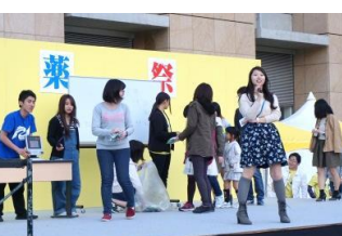
恒例のビンゴ大会