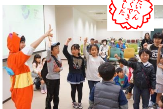
スタンプラリー～がんばりました！