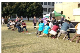
学長杯スポーツ大会～綱引き みんな力が入りました！