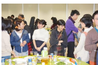
ホームcomingパーティー