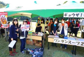
お茶の水キャンパス～ギョウザ&ワンドンスープ