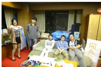
学園祭実行委員会