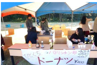
バドミントン部～ひとくちドーナツ