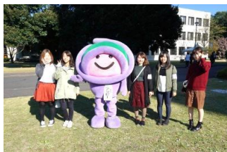
今年も人気のアッピーです！