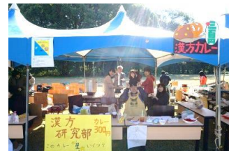
漢方研究部～薬膳カレー