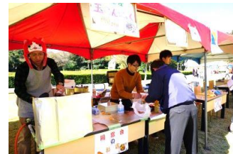
同窓会～玉こんにゃく