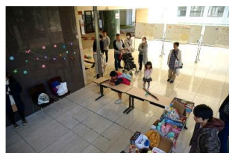
天体観測～すばる～同好会