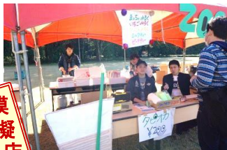
ダンス部～タピオカドリンク