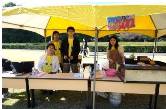
実行委員会はお好み焼きです