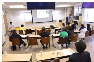
サイエンス同好会